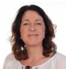
Hester Tent Groep 4/5 (wo, vr) Groep 1-2 (do)