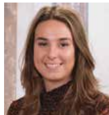
Cheyenne Arts Onderwijs- assistent (ma-mo, vr-mo)